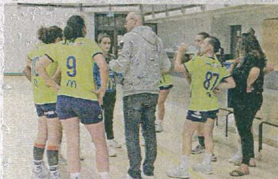
▲ Le coach donne les instructions.

Samedi 14 octobre, réception du 1 er plateau U11G. Les équipes A et B joueront contre l'équipe de Rodez à 14 h au gymnase de Notre-Dame. Les U15F (A) recevront Saint-Affrique à 14 h 30 au gymnase de La Vernède, elles seront suivies des U17F face à Montagnac à 16 h 30. Les U18G affronteront Saint-Affrique à 18 h 30 en ouverture de l'équipe réserve féminine à 20 h 30 face à Séverac. Les U13F seront en déplacement à Levezou à 13 h. Les U15G iront à Lansargues à 14 h 30. Les U13G (B) et la réserve masculine seront à Millau pour des matchs à 15 h et 19 h 30. Dimanche 15 octobre, les U13G (A) se rendront à Eigeac à 14 h. Les U11F ainsi que les séniors filles seront à Rodez.