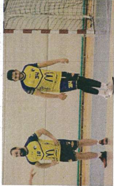
▲ Les Mendois n'ont jamais été inquiétés à Montpellier.

LES FILLES ASSURÉES D'ÊTRE EN PLAY-OFF DÉBUTERONT LEUR SECONDE PARTIE DE SAISON SAMEDI 2 MARS