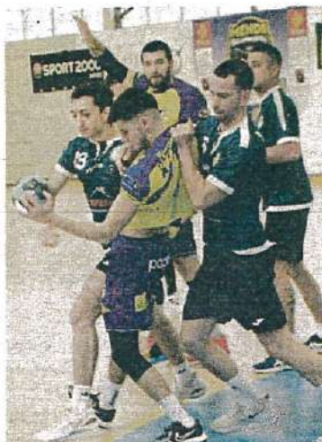
▲ Les Mendois sont classés 3 e à trois points du leader.

Les Mendois imposent le rythme. Efficaces en attaque et regroupés défensivement, ils récupèrent des ballons et exploitent la moindre faiblesse adverse. À 15 minutes de jeu, le score est de 11-6. Sur cette fin de période, les Jaunes et bleus