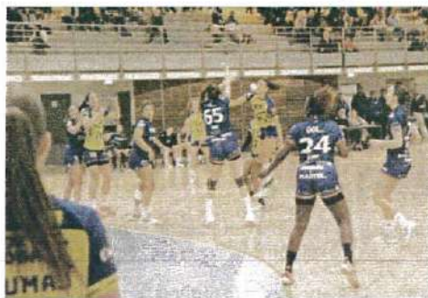
▲ Les filles toujours secondes au classement.

Excellence masculine: Mende 36 - Alès 24 (20-9).