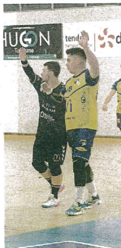
▲ L'aventure coupe de France s'arrête pour les garçons.