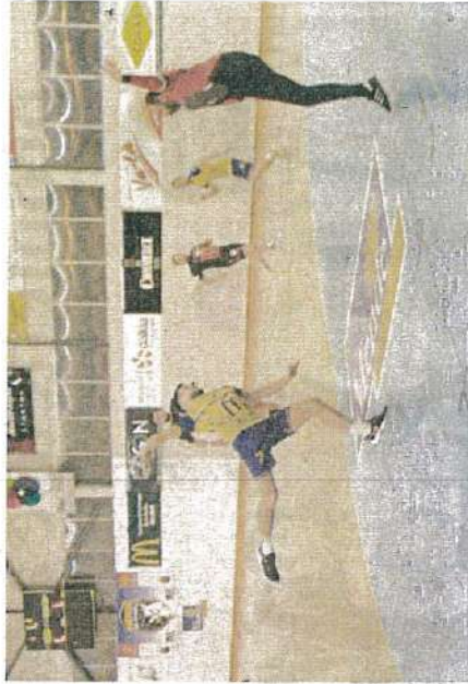
▲ Les Mendois ont égalisé à 40 secondes de la fin.