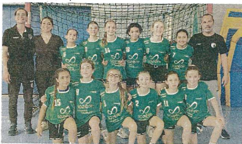
▲ Les U13 filles sont qualifiées pour les finalités de zone.

Samedi, les U13F se déplaçaient à Albi (81) pour leurs finalités de secteur. En demi-finale, face à l'entente Albi/Mazamet, les Mendoises gagnent 13-23 avec notamment un dernier tiers-temps de folie. Dans l'autre demi-finale Saint-Affrique (12) prend le dessus sur Ovest Tarn en arrachant la victoire d'un petit but 23-22. Pour la finale, le match débute très timidement pour les Lozériennes qui ont du