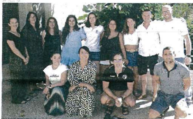
▲ Les bénévoles sont prêts pour cette nouvelle saison.

« Ce résultat négatif provient de nos dépenses de carburant qui ont augmenté de 30 000 €, a expliqué la présidente. Je ne suis pas inquiète car on avait provisionné 20 000 € pendant