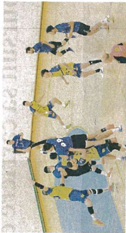
▲ Les Mendois joueront leur match de barrage samedi soir.

Samedi dernier, les seniors féminines jouaient leur dernier match de la saison. Assurées depuis fin avril de monter en Nationale 2, les Jaunes et bleues souhaitaient offrir une dernière victoire à leurs supporters. Solides défensivement, les Mendoises récupèrent les ballons