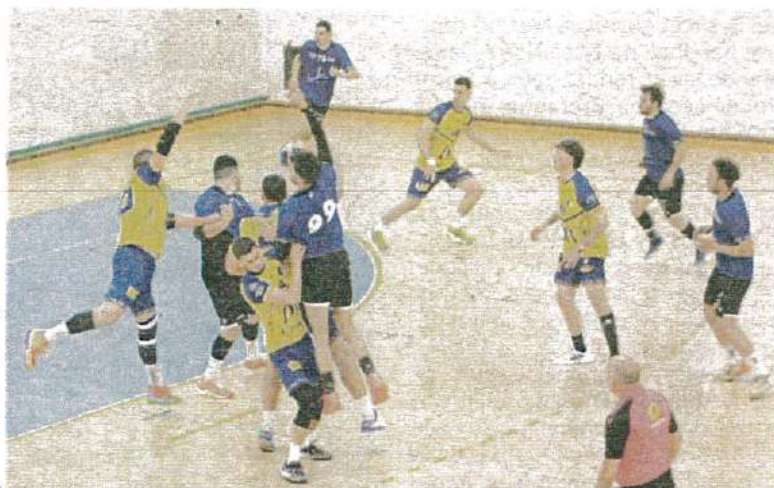
▲ Les garçons du MGC joueront le match aller des barrages le week-end des 1 er et 2 juin.

Pour leur dernière rencontre de la phase régulière, les garçons se déplaçaient à Montpellier. Assurés d'aller