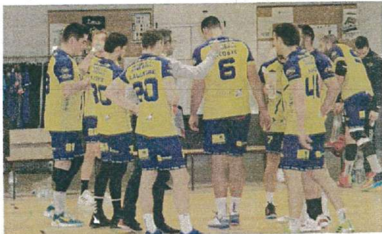
▲ Les garçons ont deux semaines pour préparer la venue du CSC Nîmes.