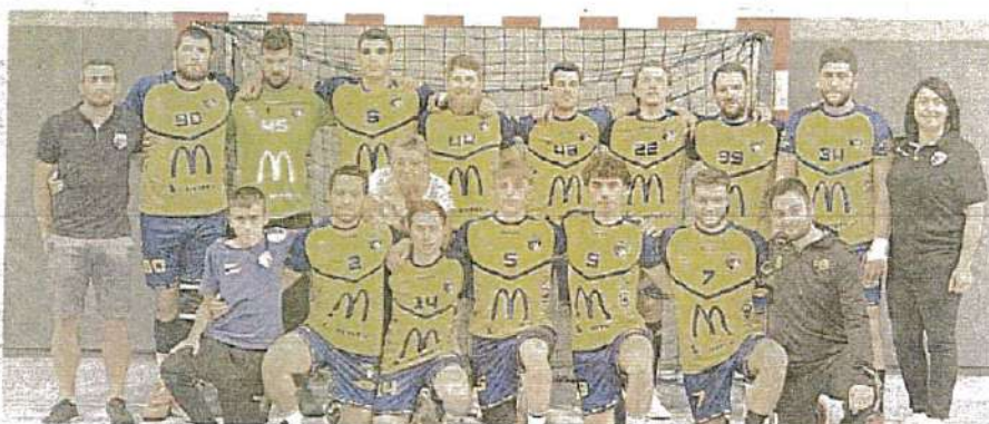
▲ Les Mendois se sont imposés logiquement à Trèbes.

Barrage accession : Trèbes/ Puichéric 31 - Mende 46 (mi-temps 11-21).