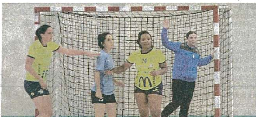
▲ Après deux matchs, les Mendoises sont en tête de leur poule.

Samedi, pour leur premier match en championnat à Alès, les garçons débutent la rencontre sur les chapeaux de roues et infligent un 0-5 en 8 minutes. Ils maintiennent le