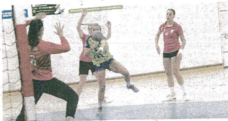
▲ Les filles ont été très efficaces au tir.