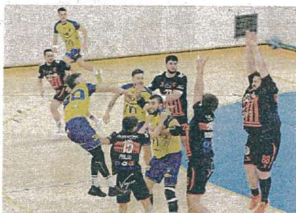
◀ L'Excellence masculine s'impose face à ses concurrents directs à montée, les Cheminots nîmois.

Le début de seconde période est serré, aucune équipe ne voulant laisser l'avantage. Le score à la 40 e est de 17-17. Les Mendoises, comme en première période, prennent le dessus défensivement et sont efficaces au tir derrière. Elles passent devant au score, 19-21 à la 50 e . Mais scénario est identique à la fin de mi-temps précédente, les Jaunes et bleues ont du mal à terminer et leurs adversaires du soir en profitent pour grignoter leur retard. À 1 minute